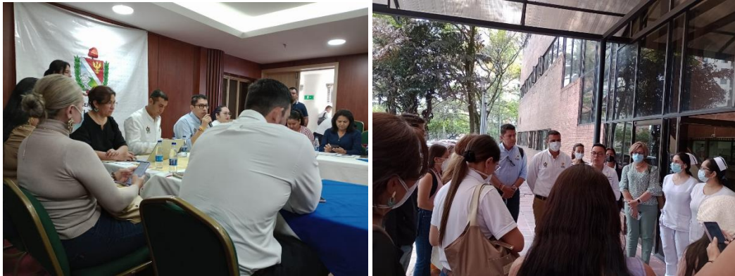
Figura 2. Cuarto Consejo de Política Social

Actividad No.4 Se participa en el cierre a los planes de acción de los diferentes mesas, comité y subcomités (alrededor de 40 instancias) relacionados a infancia y adolescencia, entre otros: comité Departamental de seguridad alimentaria y nutricional, Comité para la Erradicación del Trabajo Infantil, Mesa de salud mental, Ruta integral para la erradicación de la explotación sexual comercial en N,N,A, subcomité diferencial étnico de víctimas, comité de vida saludable y condiciones transmisibles, mesa técnica proyecto de vida y emprendimiento de sistema de Responsabilidad Penal para adolescentes.