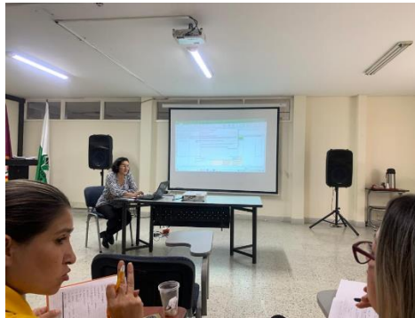
Figura 1. Registró fotográfico cuarta mesa de primera infancia, Infancia, adolescencia y fortalecimiento familiar, 5 de diciembre 2022.

Actividad No.2 Se culminó el acompañamiento del PNUD en convenio con el ICBF, para la adecuación de la RIA para la gobernación, se hizo entrega de: i) documento de balance inicial; ii) herramienta para la autovaloración de capacidades; iii) evidencias del mapeo de oferta institucional; iv) análisis situacional de niñas, niños y adolescentes; v) documento técnico para la identificación de retos, potenciales de la RIA y recomendaciones.